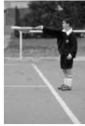
au milieu du terrain