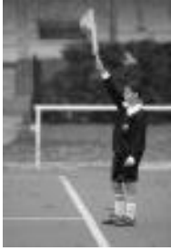
Hors jeu posé à l'assistant