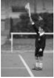
Hors jeu posé à l'assistant